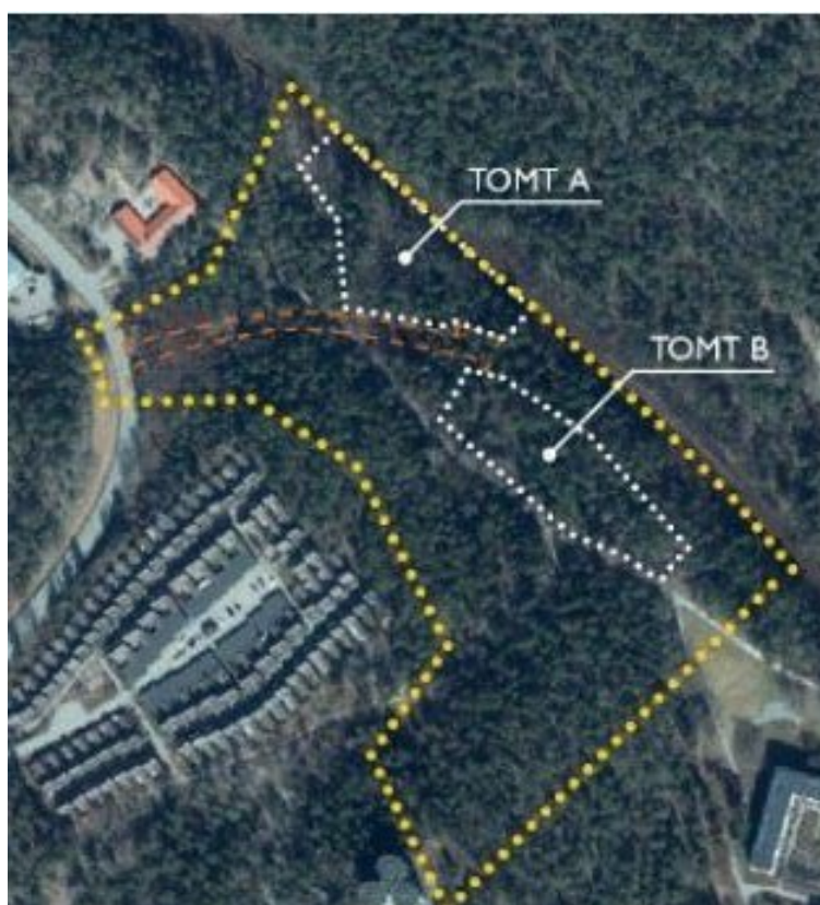
Figur 2