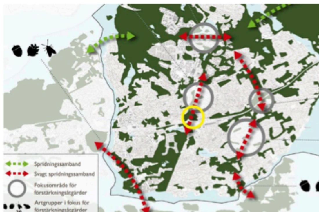
Bilden visar ett utsnitt från sidan 20 i Naturvårdsplanen, Strategisk karta – förvaltning . Vi har markerat detaljplanen för Orminge trafikplats med gul ring, mitt i det svaga sambandet.

Naturvårdsplanen har höga ambitioner framförallt gällande skötsel av naturområden på kommunal mark men även gällande att stärka de gröna sambanden i kommunen. Hur ambitionerna avseende skötsel kommer att förverkligas är i stor utsträckning en budgetfråga om hur stora anslag kommunen är beredd att avsätta för ändamålet. När det gäller de gröna sambanden däremot är det inte bara en fråga om budget utan i stor utsträckning även en fråga om hur mycket de gröna värdena tillåts påverka och styra den fysiska planeringen i kommunen. Till exempel av Strategisk karta - förvaltning på sidan 20 framgår att det finns ett svagt samband mellan Orminge centrum i norr och Kocktorpssjön och Tollare i söder. Mitt i detta svaga samband har kommunen antagit en detaljplan, Verksamhetsområde vid Orminge trafikplats , som tar bort större delen av det största naturområdet i detta svaga samband (se bilden nedan).